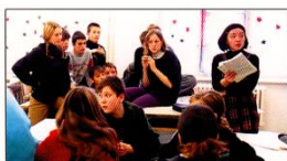
Oblastní sdružení Kritické myšlení a Step by Step ČR